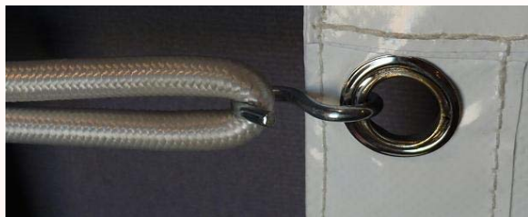
Sistema tradicional de ojetes

Es necesario medir la distancia para centrar los ojetes en el momento del montaje.